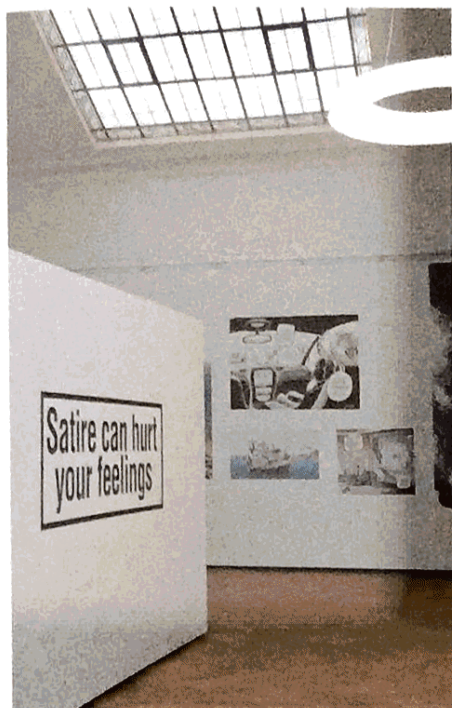
Salle d'exposition aménagée dans l'ancien bâtiment avec une verrière Art Nouveau témoignant de son histoire architecturale.